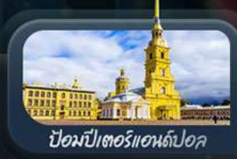
ป้อมปีเตอร์แอนด์ปอล