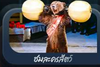
ชมละครสัตว์

highlight สองเมืองไฮไลท์ของรัสเซียที่ไม่ควรพลาด! ตื่นตาตื่นใจกับมหาวิหารเซนต์บาซิล ชมความยิ่งใหญ่ของจัตุรัสแดง สัมผัสอดีตที่พระราชวังเครมลิน ชมความงามของสถานีรถไฟใต้ดินมอสโก ชาร์กอร์ส โบสถ์ไอสิกรีนดี เป็นเขาสเปร์โรว์ให้คุณได้สัมผัส ชมความงามพระราชวังฤดูหนาว พิพิธภัณฑ์ฮอร์มิงทง ป้อมปีเตอร์แอนด์ปอล และมหาวิหารเซนต์ไอแซค