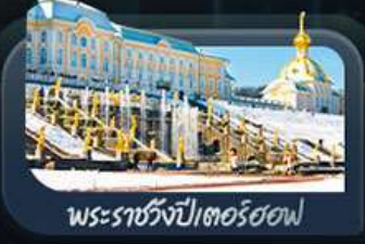
พระราชวังปีเตอร์ฮอฟ