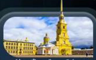
ป้อมปีเตอร์แอนด์ปอล