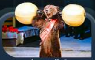
ชมละครสัตว์

สองเมืองไฮไลท์ของรัสเซียที่ไม่ควรพลาด! ตื่นตาตื่นใจกับมหาวิหารเซนต์บาซิล ชมความยิ่งใหญ่ของจัตุรัสแดง สัมผัสอดีตที่พระราชวังเครมลิน ชมความงามของสถานีรถไฟใต้ดิน มอสโก ชาร์กอร์ส โบสถ์ไอสิกริบดี เป็นเขาสเปร์โรว์ให้คุณได้สัมผัส ชมความงามพระราชวังฤดูหนาว พิพิธภัณฑ์เฮอร์มิเทจ ป้อมปีเตอร์แอนด์ปอล และมหาวิหารเซนต์ไอแซค