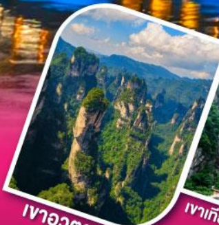
เวาอวดาร