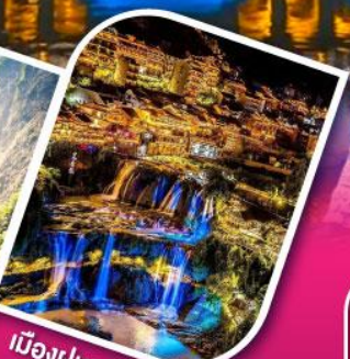
เมืองผู่หงเจิ้น