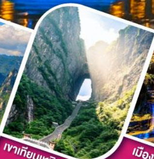
เวาเทียนเหมินชาน