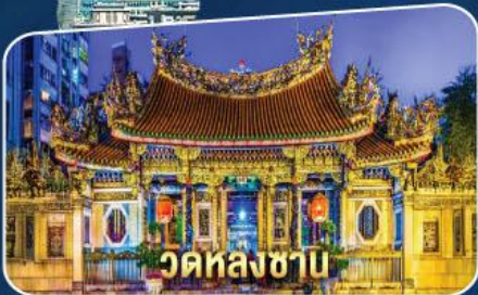
วัดหลงซา