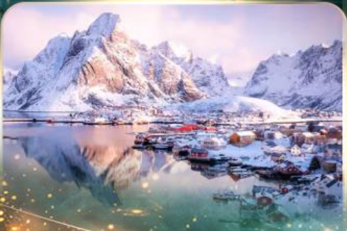
หมู่บ้านเรนเน