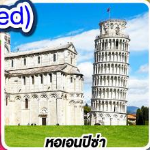
หอนอนปิซ่า