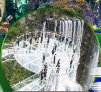
สะพานแก้วถ้ำหลงเซี่ยะ