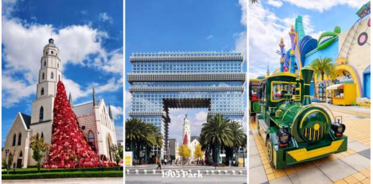
วัดหยวนทง – PARK1903 – สนามบินคุนหมิงฉางชู่ย – กรุงเทพฯสุวรรณภูมิ (อิสระอาหารกลางวัน)

จากนั้นนำท่านสู่ Park 1903 (สวน 1903) แลนด์มาร์คสุดชิค ได้กลิ่นอายยุโรปและศูนย์การค้าไลฟ์สไตล์ใจกลางเมืองคุณหมิง (มณฑลยูนนาน) ที่โดดเด่นด้วยการจำลองสถาปัตยกรรมสไตล์ยุโรป ผสมผสานศิลปะ ความบันเทิง และสวนสนุกเข้าไว้ด้วยกันอย่างลงตัว สถาปัตยกรรมจำลอง ประตูชัยปารีส อันโด่งดังโบสถ์คริสต์ (Gospel Auditorium) และพื้นที่จัดแสดงนิทรรศการPop Mart สาขาใหญ่ สำหรับสายอาร์ตทอยสวนสนุก Dream Park: สวนสนุกที่มีทั้งโซนในร่มและกลางแจ้ง (ตั๋วไม่รวมค่าเข้าสวนสนุก)เป็นแหล่งเสื้อผ้าแบรนด์เนมทั้งของจีนและต่างประเทศ เครื่องประดับอัญมณีชิ้นเยี่ยม ร้านเครื่องดื่ม ร้านอาหารพื้นเมือง