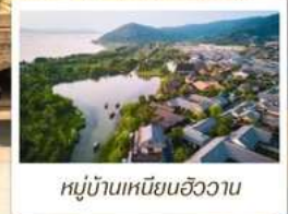
หมู่บ้านเหนียนฮิววาน