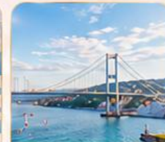
BOSPHORUS STRAIT ช่องแคบบอสฟอรัส