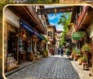
เดินเล่นย่านเมืองเก่าบรรยากาศย้อนยุค