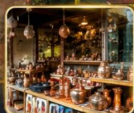
เลือกซื้อของฝากงานหัตถกรรมพื้นเมือง

สัมผัสเสน่ห์แห่งอดีตในเมืองที่เวลาเดินช้าลง กับสถาปัตยกรรมอันงดงาม วัฒนธรรมที่ยังคงมีชีวิต และความอบอุ่นจากผู้คน