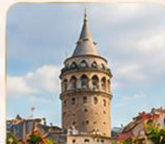
GALATA TOWER หอคอยกาลาตา