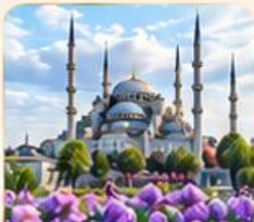
BLUE MOSQUE สุเหร่าสีน้ำเงิน