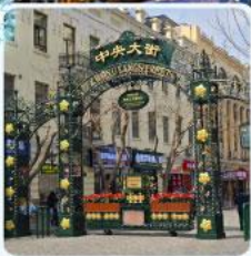
ถนนจางยาง