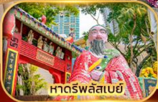
หาดร์พลัสเบย์