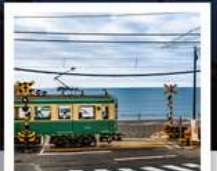
รถไฟโอบะเด็น