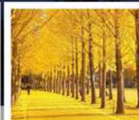
สวนเอิกซโป