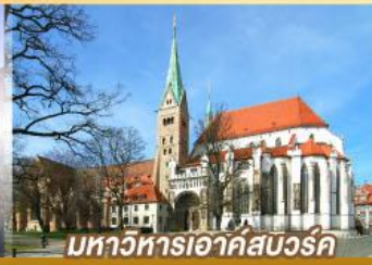
มหาวิหารเอาก์สบูร์ค