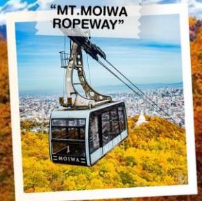
“MT. MOIWA ROPEWAY”