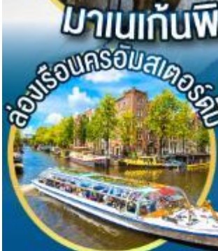
ล่องเรือนครอัมสเตอร์ดัม