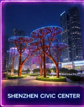
SHENZHEN CIVIC CENTER