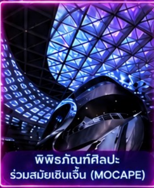
พิพิธภัณฑ์ศิลปะ ร่วมสมัยเซินเจิ้น (MOCAPE)