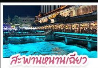
สะพานเสนาหนเลี้ยว