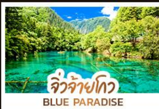
จิวจ้ายโกว BLUE PARADISE