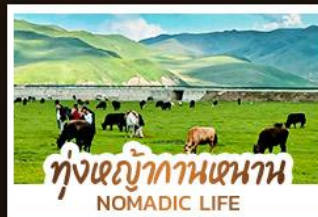
ทุ่งหญ้ากานหนาน NOMADIC LIFE