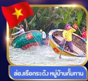
ล่องเรือกระดิว หมู่บ้านกัมกาน