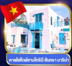
คาเฟ่สไตล์ซานโตรินี่ ชันตรา มารีน่า