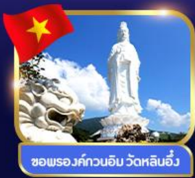
ชมพระอภิมหาอิม วัดหลินอ๋อง