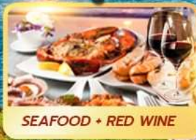
SEAFOOD + RED WINE