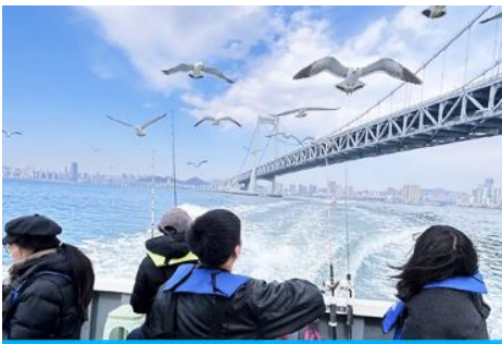
นั่งเรือใบออกทะเลลิ้นกนางนวล

ต่อด้วยนำท่านเที่ยวชมถนนรัสเซีย 俄罗斯风情街 ในอดีตที่นี่เป็นศูนย์ที่ตั้งของที่ทำการเมืองต้าเหลียน ภายหลังได้กลายเป็นชุมชนของพ่อค้าและวิศวกรทางรถไฟชาวรัสเซีย บริเวณนี้จึงเต็มไปด้วยอาคารบ้านเรือนแบบตะวันตก(รัสเซีย) มากมาย นอกจากนี้ได้เก็บภาพที่มีพื้นหลังเป็นอาคารสถาปัตยกรรมตะวันตก ที่นี้ยังมีร้านค้าที่จำหน่ายสินค้าและของที่ระลึกที่นำเข้ามาจากรัสเซีย อาทิ ช็อกโกแลต เหล้าวอดก้า ตุ๊กตารัสเซีย ฯลฯ