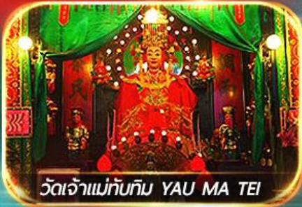
วัดเจ้าแม่ทับทิม YAU MA TEI