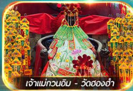
เจ้าแม่กวนอิม - วัดสองอ้า