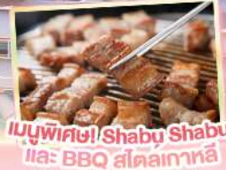
เมนูพิเศษ! Shabu Shabu และ BBQ สไตล์เกาหลี

เดินทาง พฤษภาคม - ตุลาคม 69 สายการบิน AIR BUSAN (BX) AIR BUSAN น้ำหนักกระเป๋า 15 KG