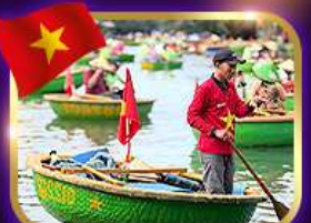
เรือกระด้ง หมู่บ้านกิมกาน