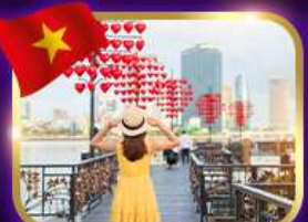
เช็คอินสะพานแห่งความรัก