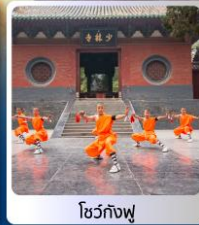
โชว์กังฟู