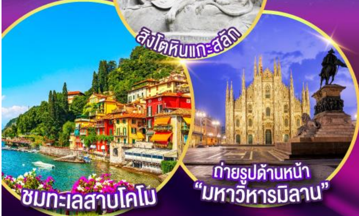
ชมทะเลสาบโคโม