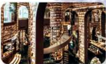
ร้านหนังสือจงซูเก๋อ