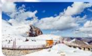
อุทยานคำกู่ปิงชวน