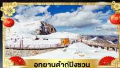
อุทยานคำกู่ปิงชวน