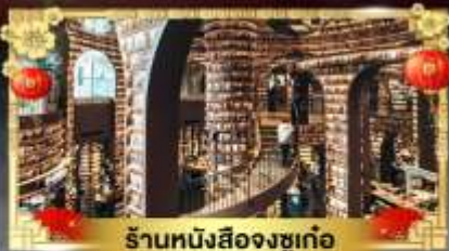
ร้านหนังสือจงซูเก๋อ