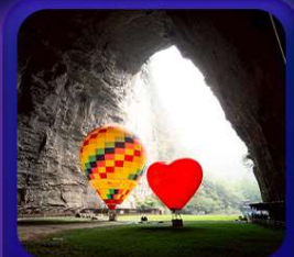
“ ถ้าถึงหลง ”