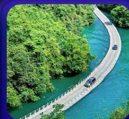
“ ทิวเขาสิงโต ซื่อจื่อกวน ”