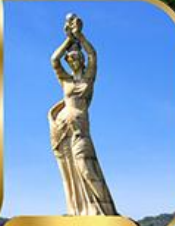
จูไห่ฟิชเชอร์เก็ร่า