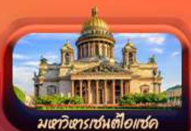
มหาวิหารเซนต์ไอแซค