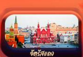
จัตุรัสแดง