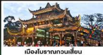
เมืองโบราณทวนเสียน