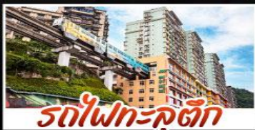
รถไฟฟ้า-คูตัก