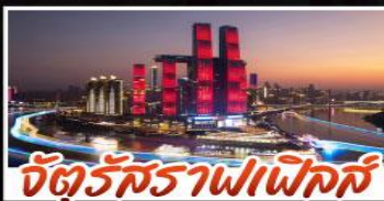
จัตุรัสราฟเฟิลส์