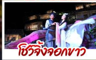
ชีวิตจริงจอกงวา