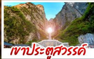
เขาประตูสวรรค์