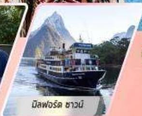
มิสฟอร์ด ซาวน์