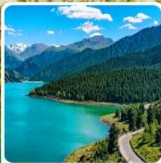
อุทยานเทียนชาน เทียนฉือ