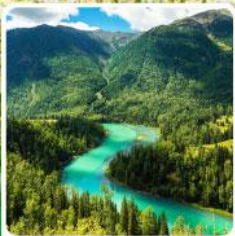
ทะเลสาบคานาสีอ