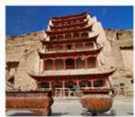
ท่าม่อเกา