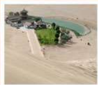
เมืองมิ่งซาซัน