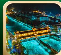
“สะพานหนานเฉียว น้ำคาสีฟ้า”