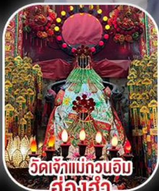
วัดเจ้าแม่กวนอิม ฮ่องฮำ