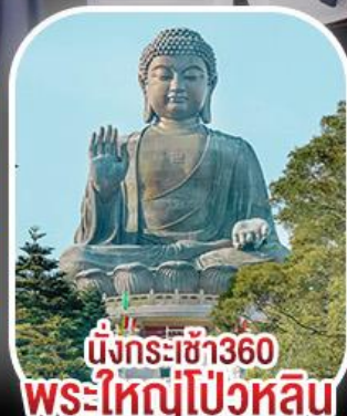
นั่งกระเช้า360 พระใหญ่โป้วหลิน