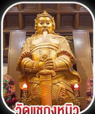
วัดเขangkงหนิว

สวนสนุก CHIMELONG SPACESHIP PARK เจ้าแม่กวนอิมรีพลีสเบย์ - เจ้าแม่กวนอิมฮ่องฮำ วัดเขangkงหนิว - พระใหญ่องปิง+กระเช้า เมนูสุดพิเศษ!! เป้าอ้อ+ไวน์แดง , ห่านย่าง