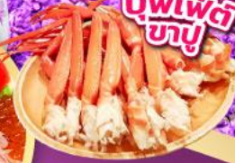
บุฟเฟ่ต์ ซาซู