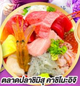
ตลาดปลาฮิมสุ คาชิโนะอิจิ