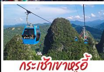
กระเช้าเขาหุ่ย