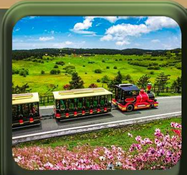
“ อุทยานเขานางฟ้า ”