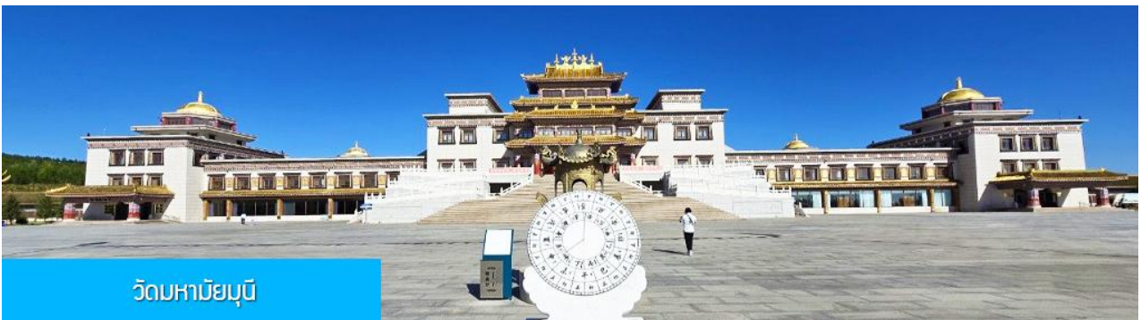
วัดมหายมุนี

พักที่ YULIN CHAOYANG INTER HOTEL โรงแรมระดับ 4 ดาวท้องถิ่น หรือเทียบเท่าในเมืองหยี่หลิน