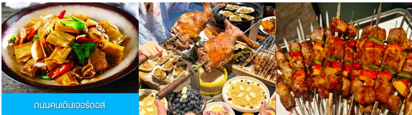
ถนนคนเดินเออร์ดอส

นำท่านเที่ยวชม สวนวัฒนธรรมหมงู่หยวนหลิว 蒙古源流 เป็นอุทยานท่องเที่ยวเชิงประวัติศาสตร์และวัฒนธรรมระดับ 4A ของจีน ที่เป็นต้นกำเนิดของชนชาติและวัฒนธรรมมองโกล สะท้อนความเป็นจักรวรรดิที่ยิ่งใหญ่เมื่อ 700 ปีก่อน ชม ประตูจงเทียน 崇天门 สุนคโพนารที่แสดงถึงความยิ่งใหญ่ของจักรวรรดิมองโกล ชม จัตุรัสเถิงเก่อหลี่ 腾格里广场 จัตุรัสกลางแจ้งขนาดใหญ่ที่ใช้ประกอบพิธีกรรมต่าง ๆ