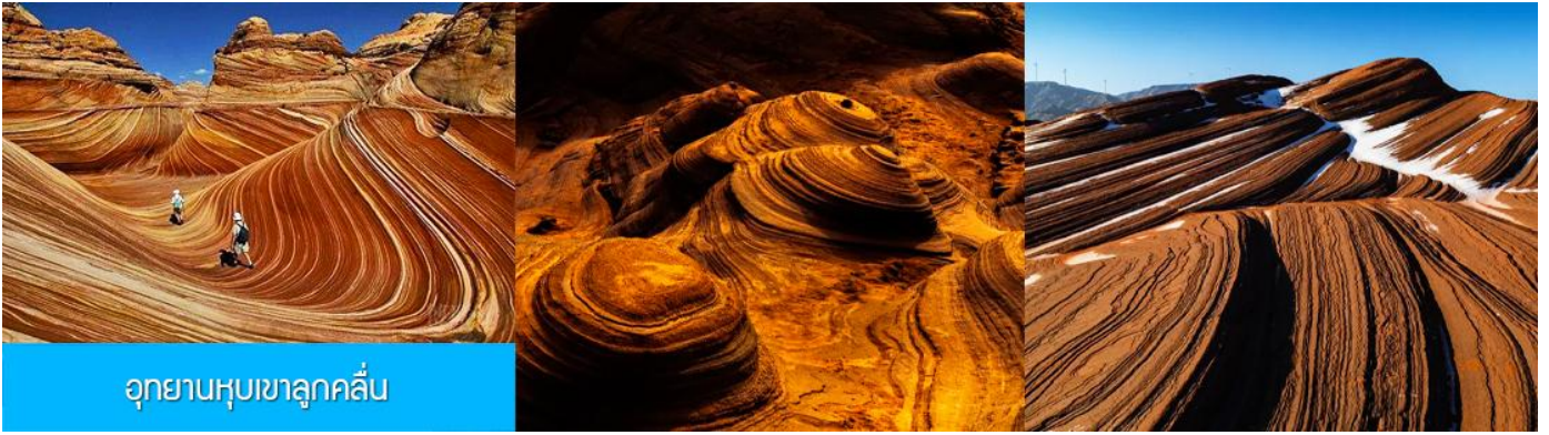
อุทยานหุบเขาลูกคลื่น