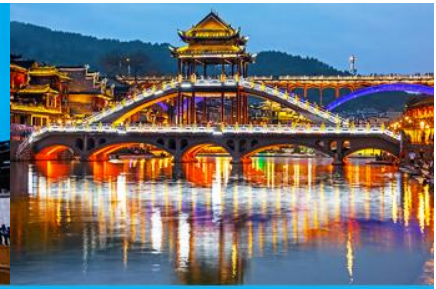
สะพานหงเจียว