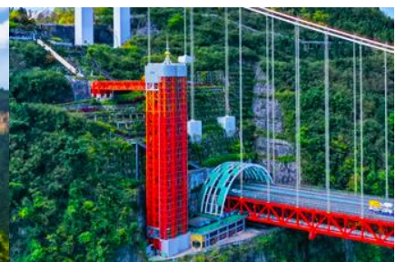
ลิฟท์แก้วอุทยานไร่จ้าย