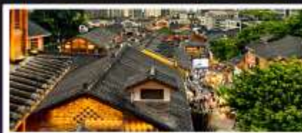
เมืองโบราณสี่ปาที้