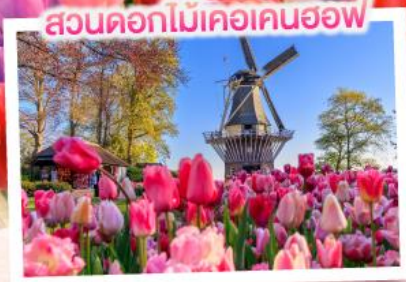
สวนดอกไม้เคอเคนฮอฟ