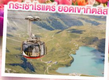
กระเช้าไรเตร ยอดเขาทิลิส