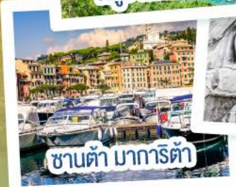
ซานต้า มารีตา