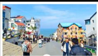
ถนนคอปเพิลิงหมายเลข 8

สัมผัสความยิ่งใหญ่ของ 4 เมืองสำคัญ ชิงเต่า - เยียนโก - เฟิงไห่ - เว่ยไห่ ปาต้ากวน - โบสถ์คาทอลิก - ตึกเก่าริมหา