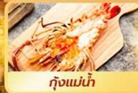
กุ้งแม่น้ำ