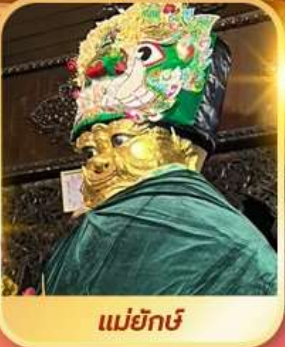
แม่ยักษ์