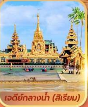
เจดีย์กลางน้ำ (สิริเยม)