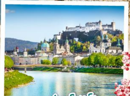
ซาลซ์บวร์ก