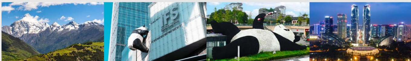
ภูเขาสี่ดรุณี (หุบเขาชวงเจียวโกว)