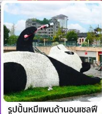
รูปปั้นหมีแพนด้านอนเซลฟี่