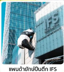
แพนด้ายักษ์ขึ้นตึก IFS